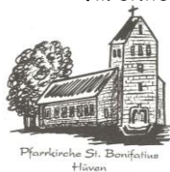
Pfarrkirche St. Bonifatius Hüven